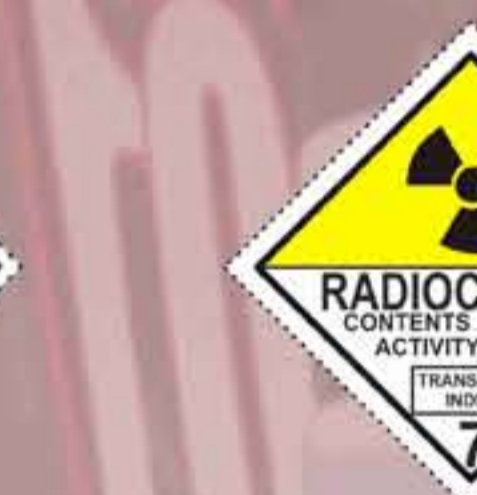
(N°7B) Materias radiactivas categoría II - amarilla