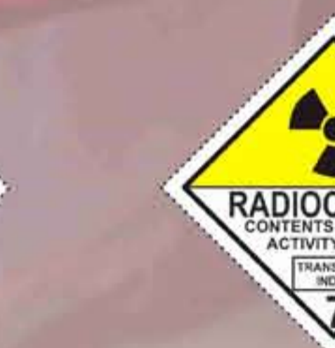
(N°7C) Materias radiactivas categoría III - amarilla