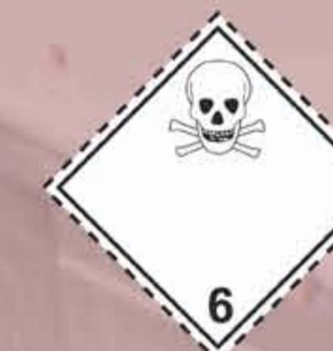
(N°6.1) Materias tóxicas