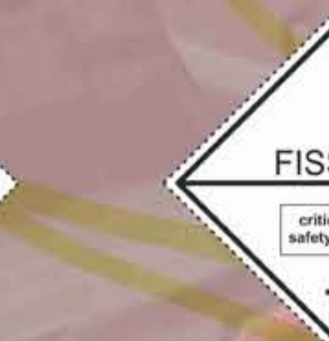
(N°7E) Materias fisionables