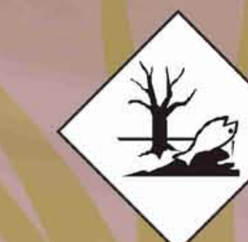
Peligroso Medio Ambiente