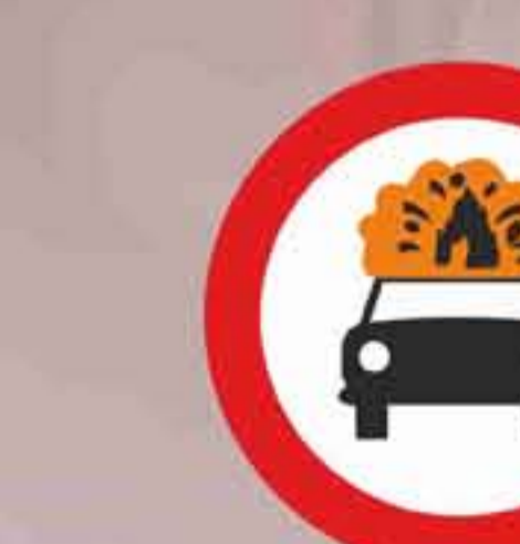
R - 109 Entrada prohibida a vehículos que transporten mercancías explosivas o inflamables