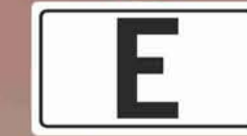
Túnel de categoría E