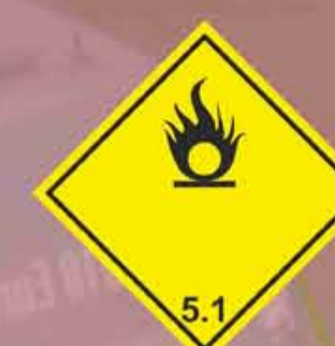
(N°5.1) Materias comburentes