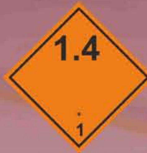
(N°1.4) División 1.4