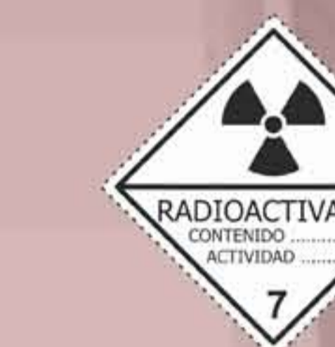
(N°7A) Materias radiactivas categoría I - blanca