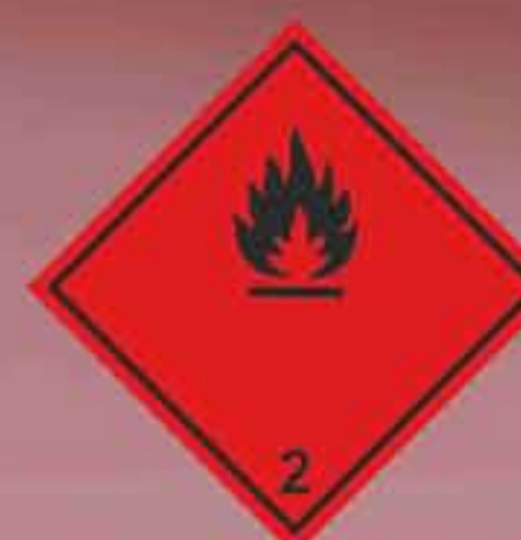
(N°2.1) Gases Inflamables