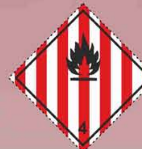
(N°4.1) Materias sólidas inflamables, materias autorreactivas y materias sólidas explosivas desensibilizadas