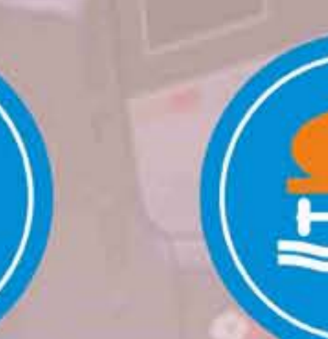
R - 415 Calzada para vehículos que transporten productos contaminantes del agua