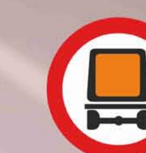
R - 108 Entrada prohibida a vehículos que transporten mercancías peligrosas