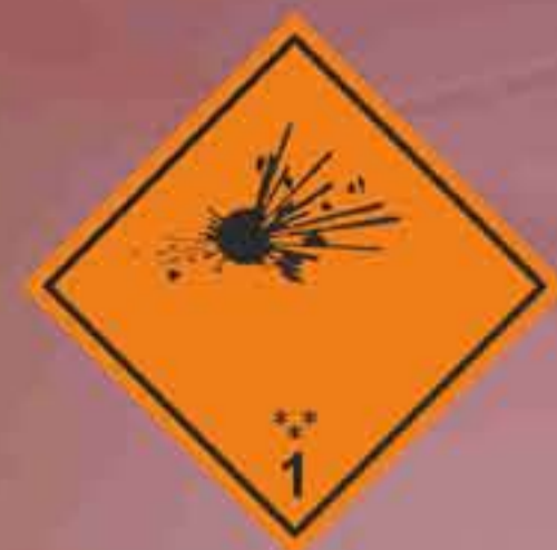
(N°1) Divisiones 1.1, 1.2 y 1.3