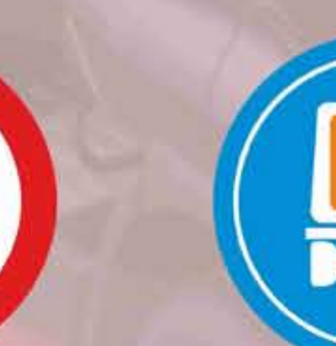
R - 414 Calzada para vehículos que transporten mercancías peligrosas