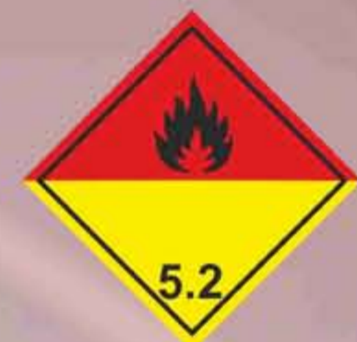
(N°5.2) Peróxidos orgánicos