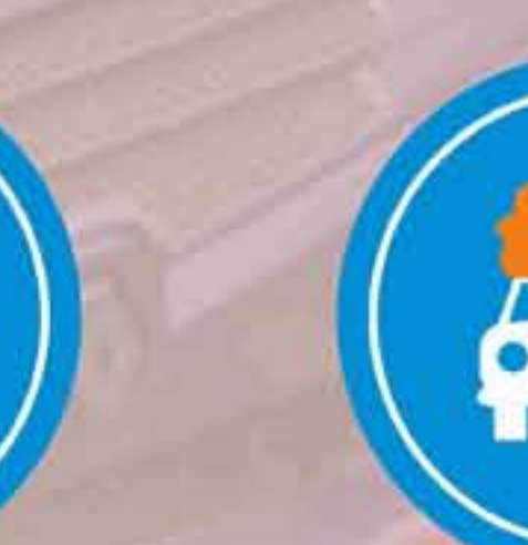
R - 415 Calzada para vehículos que transporten mercancías explosivas o inflamables