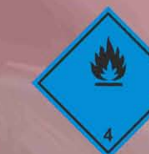
(N°4.3) Materias que, al contacto con el agua, desprenden gases inflamables