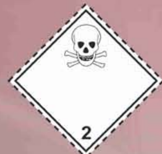
(N°2.3) Gases tóxicos