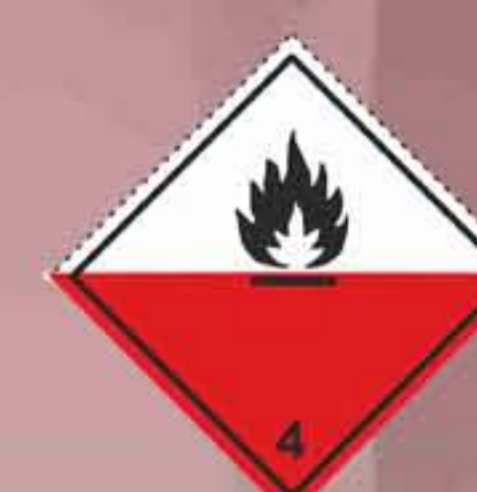
(N°4.2) Materias espontáneamente inflamables