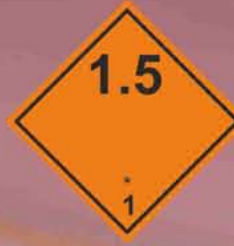
(N°1.5) División 1.5