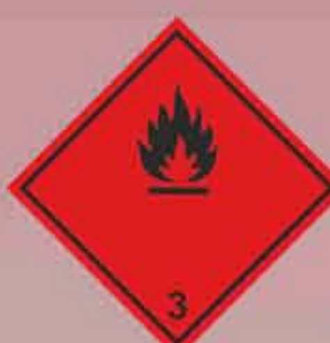
(N°3) Líquidos inflamables