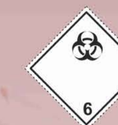
(N°6.2) Materias infecciosas