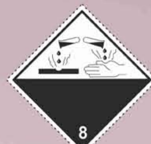
(N°8) Materias corrosivas