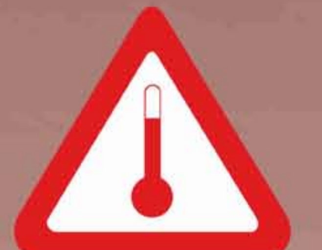
Marca para las materias transportadas en caliente