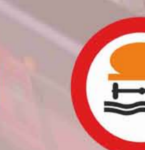
R - 110 Entrada prohibida a vehículos que transporten productos contaminantes del agua