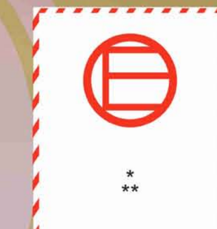
Marca de cantidades excepcionadas