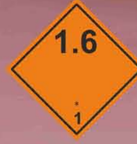
(N°1.6) División 1.6