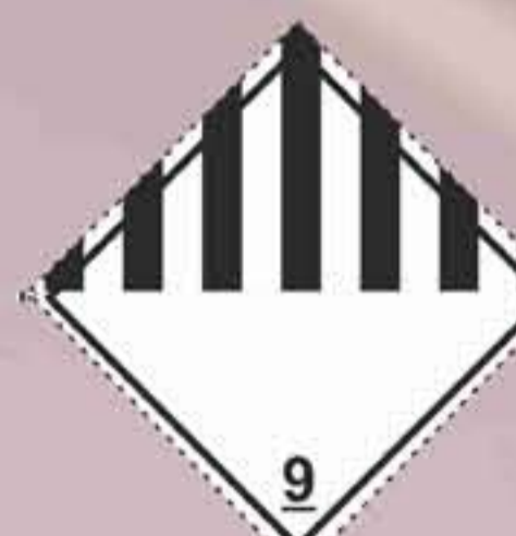
(N°9) Materias y objetos peligrosos diversos